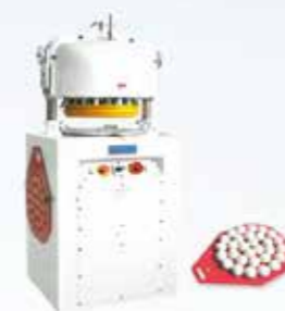
全自動分割滾圓機