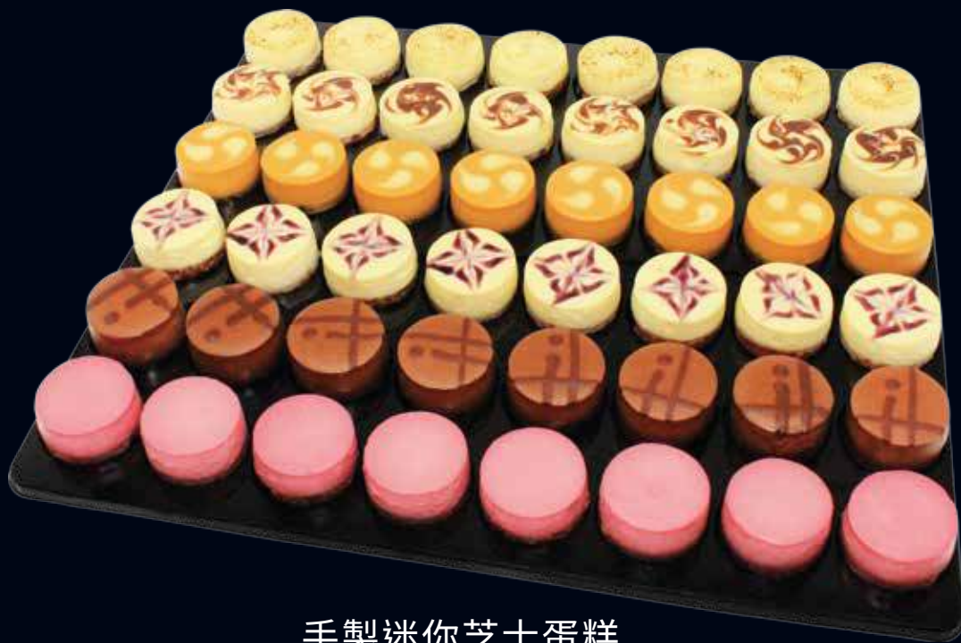
手製迷你芝士蛋糕